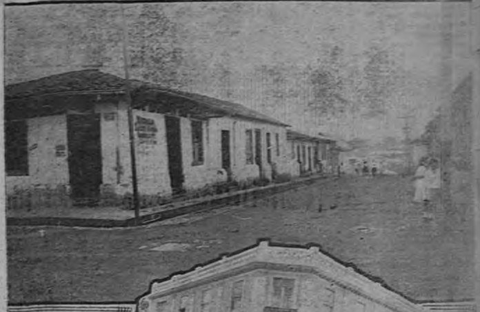
Esquina donde, el 10 de agosto de 1919 fue ultimado el General don Joaquín Tinoco. La cruz indica el sitio exacto donde cayó el señor Tinoco. Abajo: En el mismo sitio hoy día se levanta un elegante edificio.