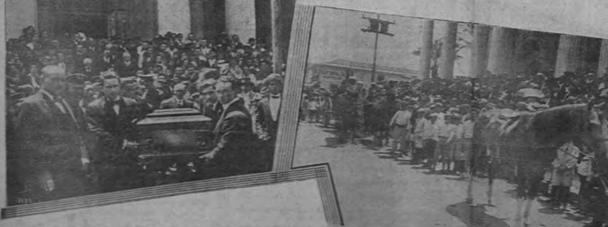
Momentos de los funerales del general Tinoco. — Al salir el cortejo de la Iglesia Metropolitana, numerosos amigos llevan en hombros la caja. — El caballo que montó el señor Tinoco, llevado en el desfile el día de los funerales.