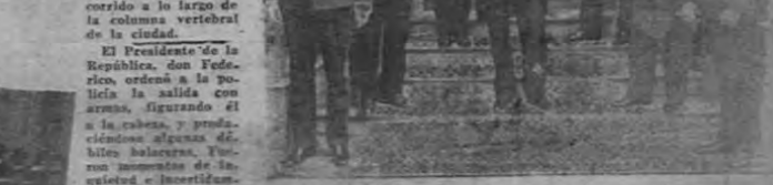
El presidente de la república don Federico Tinoco, acompañado de su hermano el ministro de guerra y demás miembros de su gabinete. Los lectores reconocerán a muchos de ellos.